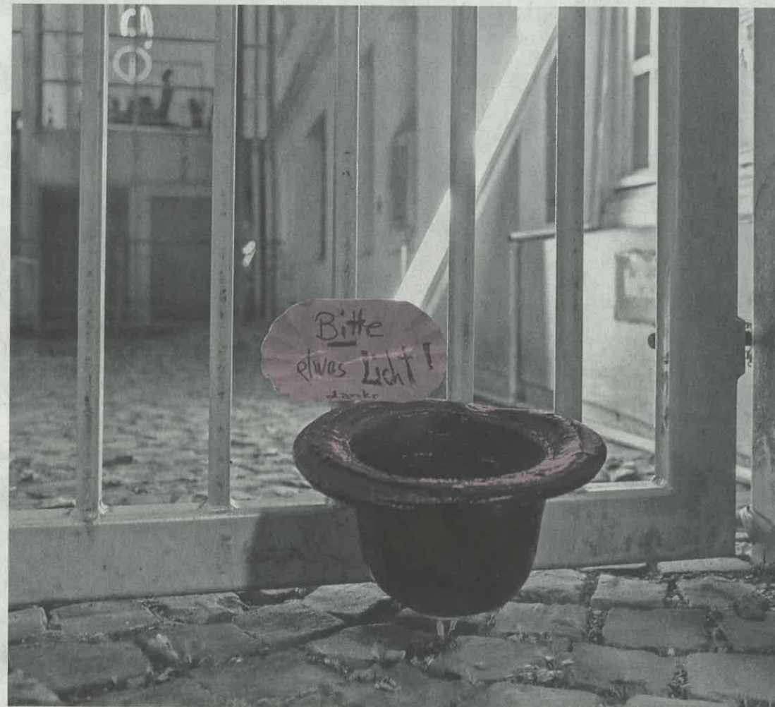
Manchmal stellen Hochschulgalerien Werke bekannter Künstler aus, doch meist stehen die Arbeiten von Studenten im Mittelpunkt. Links eine Arbeit, die in der Ausstellung „Words are my reality“ der Burg-Galerie in Halle gezeigt wurde. Rechts eine Arbeit von Alexander Paul Forré und Paul Faltz. Sie ist derzeit in einer Ausstellung mit Werken von Kölner Kunststudenten in Celle zu sehen.