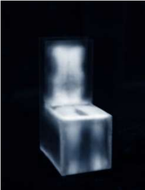
Stephan Reusse Leaving Shadows / IceChair 2011 Wärme-Restbilder auf Eisblöcken thermographische Aufnahme, C-Print,