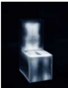
Stephan Reusse Leaving Shadows / IceChair 2011 Wärme-Restbilder auf Eisblöcken thermographische Aufnahme, C-Print,